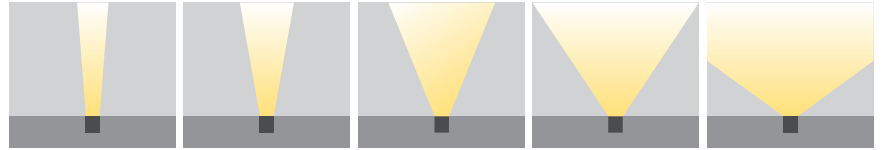
XN: Ekstra Dar Açılı (10°)