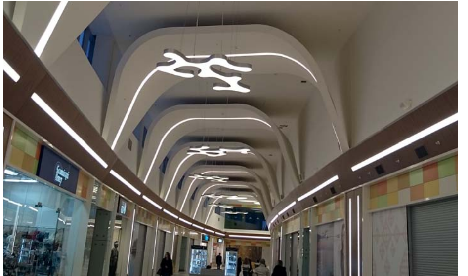
Lotus Mall, Rusya