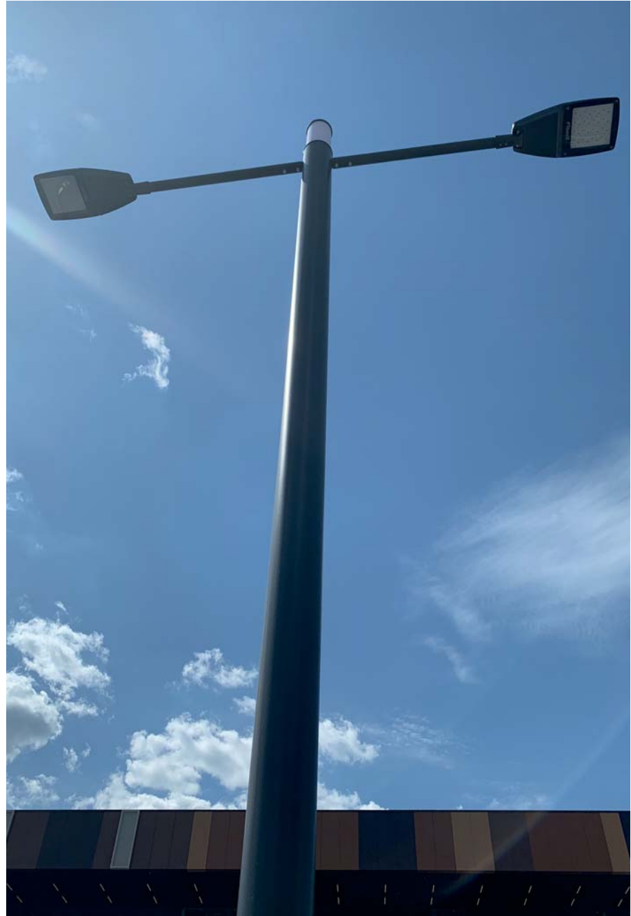
Salaris Mall, Rusya